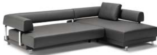
Sitzvorschub ganz ausgezogen: ca 34 cm mehr Liegefläche